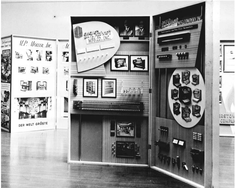
Wesel-Ausstellung in Hagerstown im Washington County Museum of Fine Arts