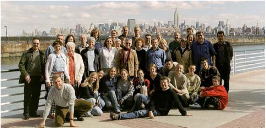
Weseler Reisegruppe und die Zirkusgruppe Butterfly vor der Skyline von New York