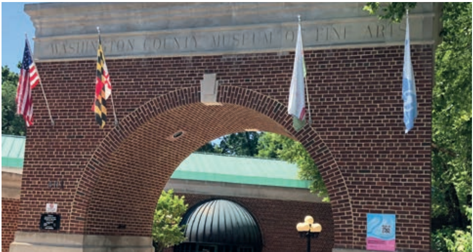
Washington County Museum of Fine Arts