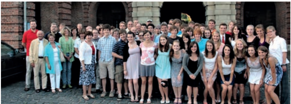
Gastfamilien des Konrad-Duden-Gymnasiums mit ihren Besucher*innen aus Hagerstown vor dem Zitadellen-Haupttor Wesel

Am Montag, den 29. Oktober 2012, war im Rathaus der Stadt Wesel ein Empfang der Bürgermeisterin Ulrike Westkamp anl. des 25-jährigen Bestehens des Schüleraustausches zwischen dem Konrad-Duden-Gymnasium in Wesel und der Hagerstown-Wesel Sister-City-Affiliation und den High-Schools in