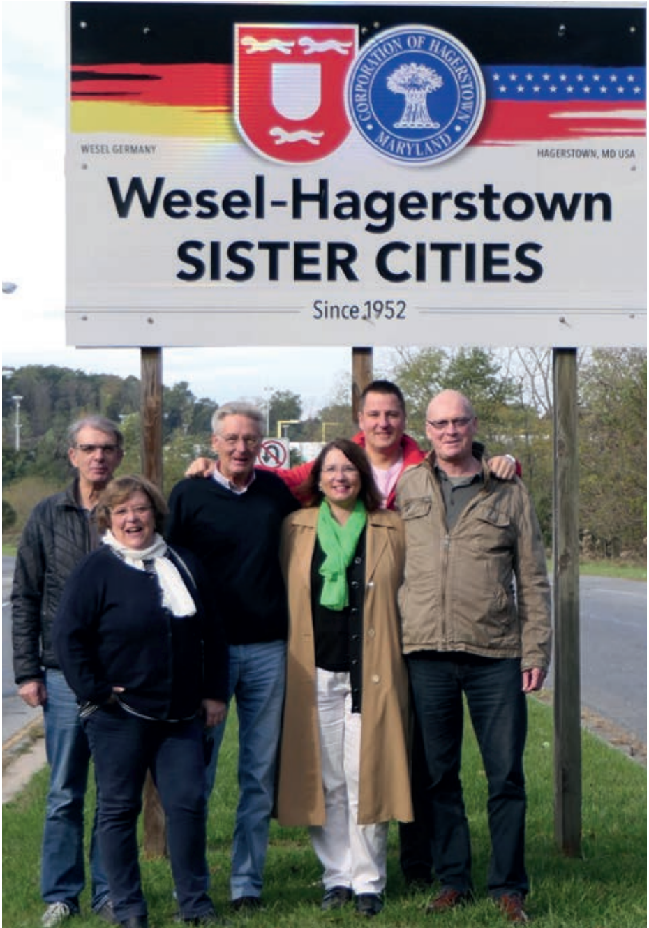
Weseler Delegation vor dem neu gestalteten und aktualisierten Partnerschaftsschild am Wesel Boulevard im Jahr 2017