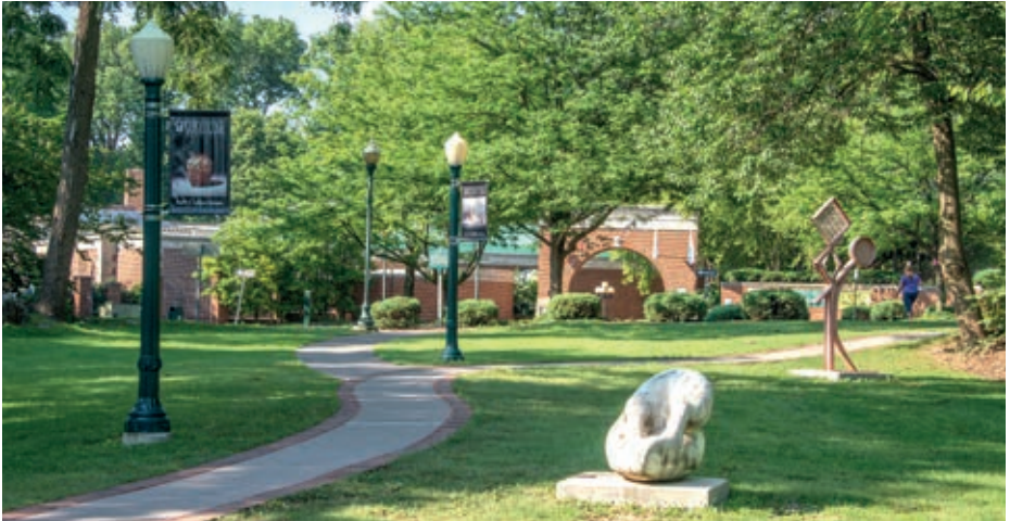
Das Washington County Museum of Fine Arts ist ein Kunstmuseum in Hagerstown.