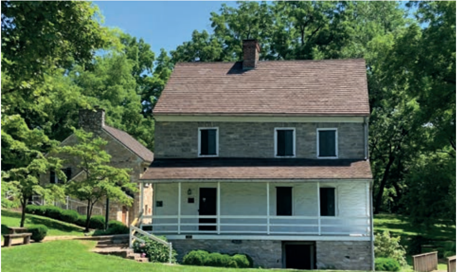
Hager House in Hagerstown aus dem Jahre 1740