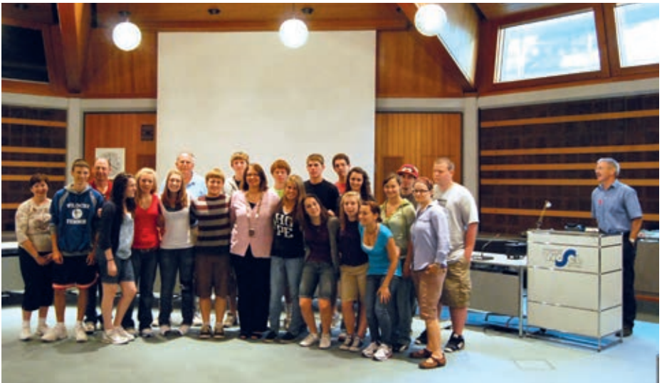
Empfang einer Schülergruppe aus Wesels Partnerstadt Hagerstown/Maryland (USA) im Weseler Rathaus

Die neue amerikanische Generalkonsulin in Düsseldorf hat für den 23. April nach Düsseldorf eingeladen. Hiermit folgt sie dem Beispiel ihres Vorgängers