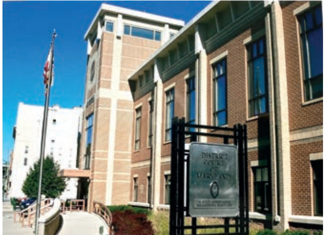
Bezirksgericht in Hagerstown