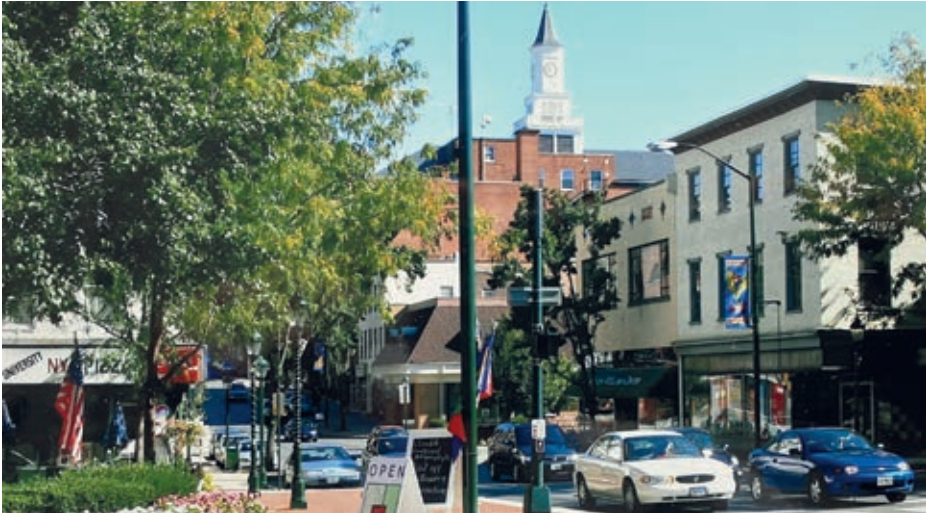
Hagerstown im Oktober 2007