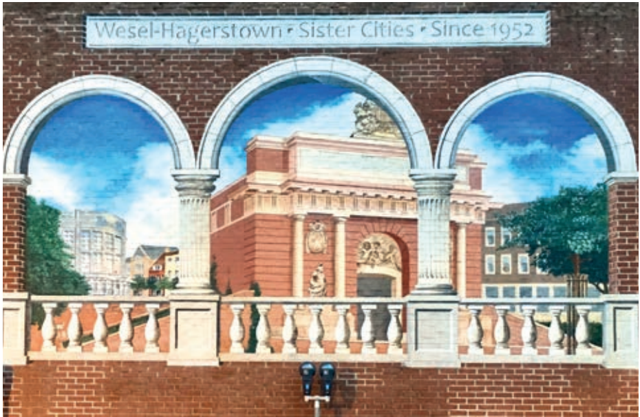
Bemalte Hauswand mit dem Weseler Motiv „Berliner Tor“ in Hagerstown