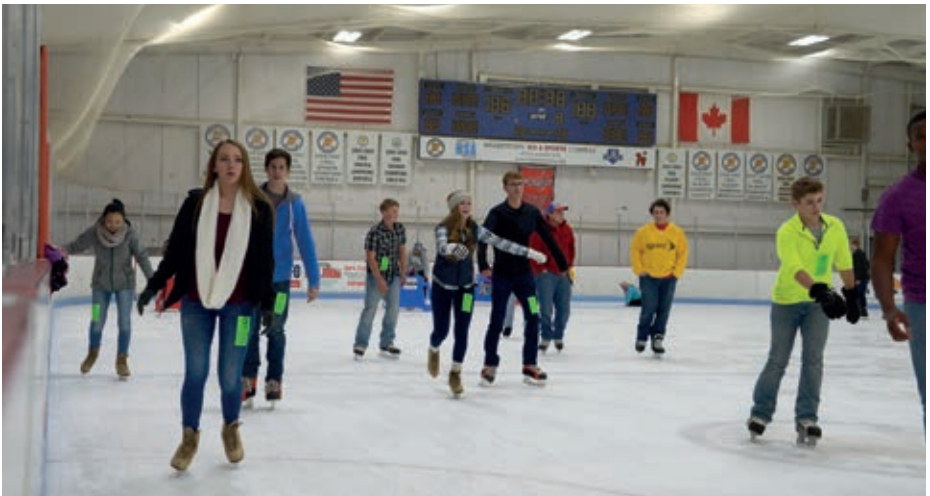
Hagerstown Ice & Sports Complex

Mit über 30 Teilnehmern*innen war das Thanksgiving-Dinner nicht nur ein Gaumenschmaus. Eine Gruppe von Schüler*innen des Konrad-Duden-Gymnasiums hatte ein Hörspiel vorbereitet und sang für die Gäste des Abends.