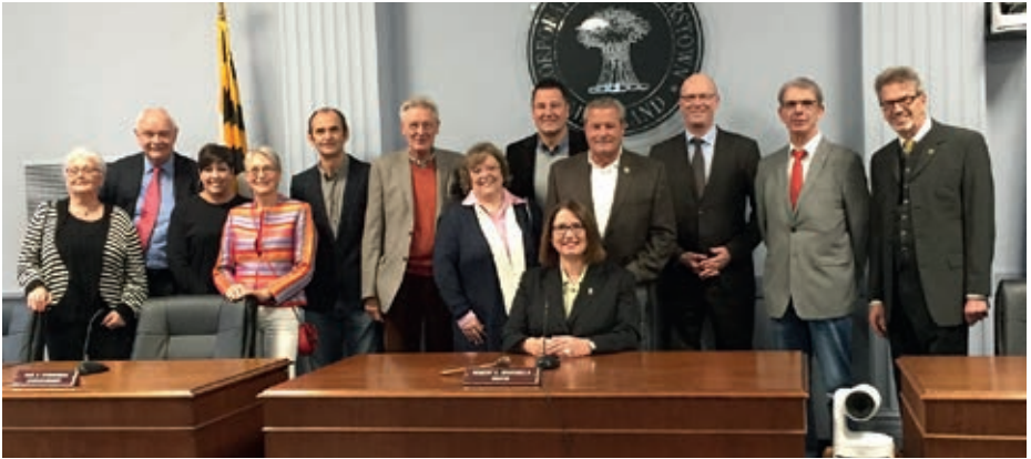
Aufenthalt einer Weseler Delegation in Hagerstown zum 65-jährigen Bestehen der Städtepartnerschaft

Trail, Besichtigung des Museum of Art, ein Picknick sowie der Besuch des Antietam Battlefield waren Höhepunkte der Reise. Besonders hat vielen deutschen Teilnehmer*innen die private Einladung in ein Haus eines Mitgliedes der Hagerstown-Wesel Sister-City-Affiliation zum Krebs-Essen gefallen. Auch die Teilnahme an der größten Parade der Ostküste war für alle interessant.