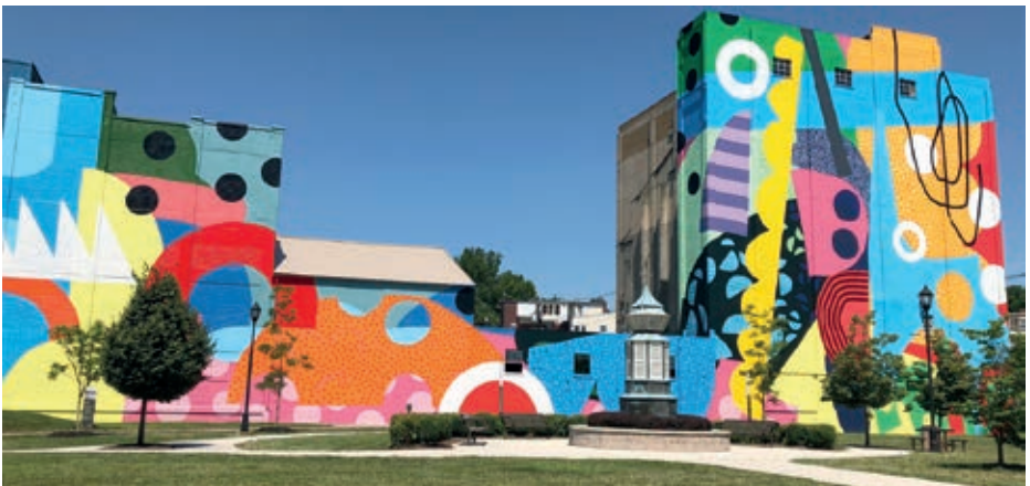
Der Hagerstown Cultural Trail ist ein Fußweg mit öffentlichen Kunsterlebnissen und einzigartiger Landschaftsgestaltung.

Die Partnerschaftsvereinigung Wesel-Hagerstown e. V. hat es wieder in die Hand genommen, die Partnerschaftsvereinigungen auf dem Vereinstag der Weseler PPP-Tage am 31. Juli mit einem Stand gegenüber der Redaktion der Rheinischen Post zu präsentieren. Dort werden neben zahlreichen Informationen auch die Flaggen der Partnerländer gezeigt.