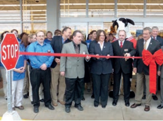
Eröffnung des Einkaufsmarktes „Hobby Lobby“ in Hagerstown